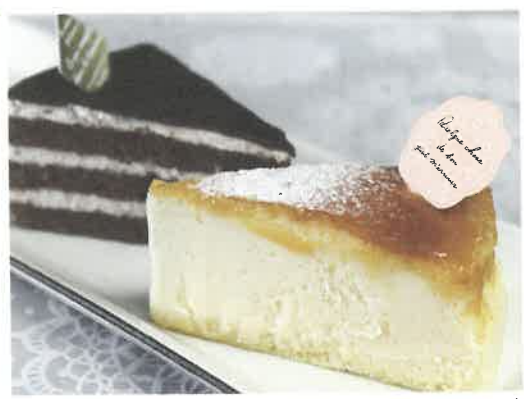
人気を二分する「焼きチーズ」と「ザッハチョコレートケーキ」(各300円)

MAP P64-E2 築上町椎田 991 (天神通り) ☎ 0930 (56) 0132 営業 11:30 ~ 14:00、18:00 ~ (夜は要予約) ☎ 火曜 休あり JR 椎田駅より徒歩で2分