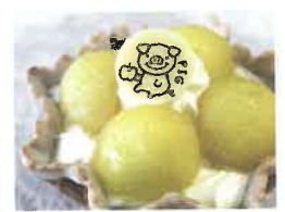
フルーツやたっぷりの生クリームなどがワッフルポートにのった「フルーツパフェ」(300円)など、ショーケースには15種類前後のケーキが毎日並びます