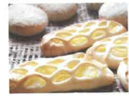
築上町越路 132-2 ☎ 0930 (56) 4194 営業 11:30 ~ 16:00 ※「メタセの杜」(P53参照)でも販売 毎月曜、その他不定 休あり 築城 IC より車で約8分