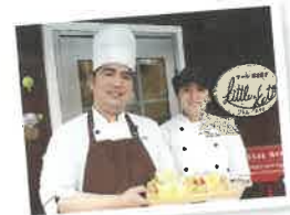
築上町築上丸 622-1 ☎ 0930 (52) 0807 営業 9:30 ~ 18:30 毎月曜、第1・3日曜 休あり 築城 IC より車で約7分