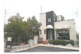
築上町築城 1436-1 ☎ 0930 (52) 4020 営業 11:00 ~ 18:00 (17:30OS) 休不定 休あり JR 築城駅より車で約4分