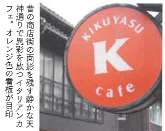
昔の商店街の面影を残す静かな天神通りで異彩を放つイタリアンカフェ。オレンジ色の看板が目印