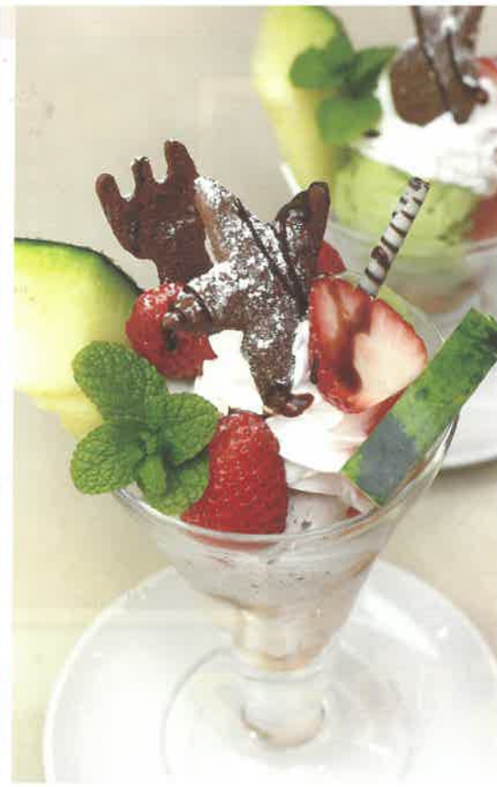
新登場の自家製アイスと旬のフルーツを使用した「フルーツパフェ」。「ミニパフェ」(360円)もオススメ!

国指定天然記念物「本庄の大楠」や菅原道真ゆかりの「網敷天満宮」など歴史遺産が点在する筑上町。「築城基地」の航空祭には、多くの人が訪れます。