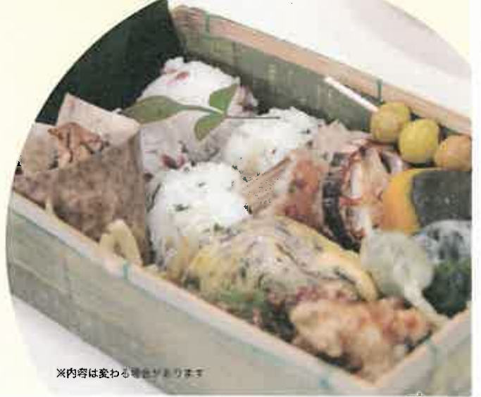
※内容は変わる場合があります

●予約・問合せ先/10月27日(月)までに要予約 ㈱アヴァンティ北九州編集部 ☎093-563-7005 平日9:30~18:00 インターネット受付 http://e-avanti.com/event/event_info ●主催/太陽旅行(福岡県知事登録旅行業第2-466)