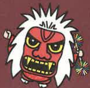
京築神楽キャラクターかさきくん 神楽の舞目に登場する「かさき」は筑田屋社、天保城館の島田氏内伝

「豊の国けいちくふるさとミュージアム」の案内人は、けいちくサルタヒコ。京築地域のさまざまな分野で活動している人たちが学び合い、京築の魅力を伝えます。昨年は、4つのテーマの「京築めぐりマップ」を作り、今年は、いまいよマップを手に京築をめぐる「サルタヒコと行く「京築ミステリーツアー」を開催。余すことのない充実した1日を楽しめること間違いなし！さあ、サルタヒコと一緒に京築ミステリーツアーへでかけませんか？今回はモニターツアーのため料金もお手頃！ご参加お待ちしております。